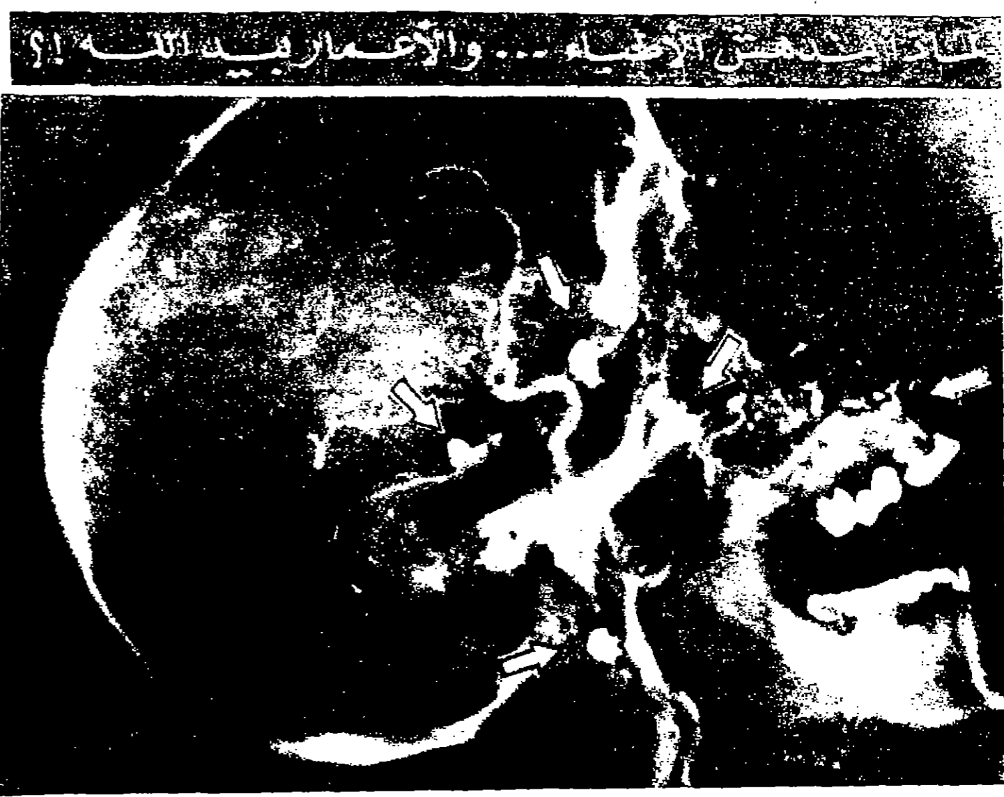
صورة الأتمة اراس المتكور والسوليمار ٥٧ سنة من مدينة جونيوبوليا الاسكا وفيه اسم نسر الاسم مواتع خمس رصاصات . وللكوتورويان قصة عجيبة فقد وجد نفسه ملقى على الارض بعد ان ضرب واطلق عليه الرصاص في ١٢ ايار الجاري ولم يبينه لمخاطرة وشبهه الا في اليوم الثاني حين توجه الى المستشفى ، وهناك اكتشفه اطباء بلطفه ان كل واحد من الرصاصات الخمس التي اصابت كتفه كلفته ومع ذلك فما يزال المتكور وليانز حيا برزق . ويقول الاطباء انهم قد لا يتزعزع الرصاصات التي العملية الجراحية ستكون اكثر خطرا من حاقلة المراهنة